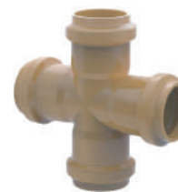
Cruzeta PBA DE 60 • DE 85