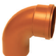
Curva 90° Curta Coletor PB DN 100 • DN 150