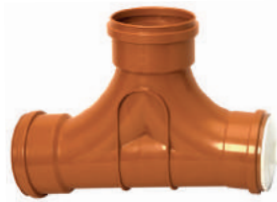
TIL Ligação Predial DN 100