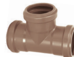
Te BBB DE 60 • DE 85 • DE 110

CL 20 DN 50 / DE 60 • CL 20 DN 75 / DE 85 CL 20 DN 100 / DE 110