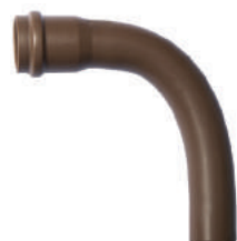
Curva 90° PBA DE 60 • DE 85 • DE 110

CL 15 DN 50 / DE 60 CL 15 DN 75 / DE 85 CL 15 DN 100 / DE 110