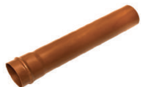
Tubo Coletor JEI DN 100 / DE 110 • DN 150 / DE 160 DN 200 / DE 200 • DN 250 / DE 250 DN 300 / DE 315