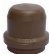
CAP PBA DE 60 • DE 85 • DE 110