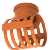
Selim com Trava e Anel DN 100 • DN 150