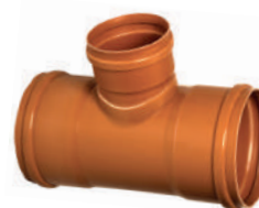
Redução Coletor DN 100 X DN 150