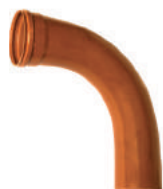
Curva 90° Longa Coletor PB DN 100 • DN 150