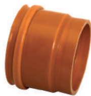
Cap Coletor DN 100 • DN 150 • DN 200