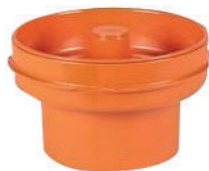
Tampão Coletor Completo p/ Til DN 100MM • DN 150MM