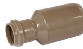
Redução PBA DE 85 x DE 60 DE 110 x DE 85