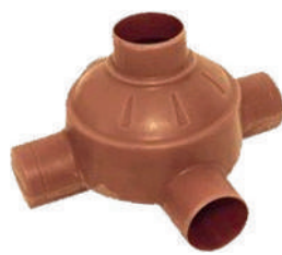
CTL Condominal (Caixa Transição Limpeza)