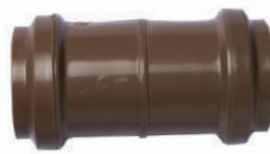
Luva de Correr PBA DE 60 • DE 85