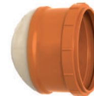
Selim Compacto DN 200 X DN100 DN 200 X DN150