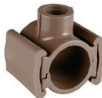
Colar de Tomada PVC 60MM x 3/4 • 85MM x 3/4