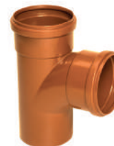
TE Coletor BBP DN 100 • DN 150