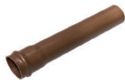
Tubo PBA JEI CL 12 DN 50 / DE 60 • CL 12 DN 75 / DE 85 CL 12 DN 100 / DE 110