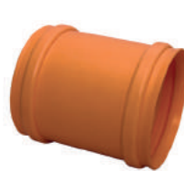
Luva de Correr Coletor DN 100 • DN 150