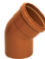
Curva 45° Curta Coletor PB 100